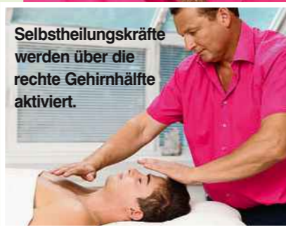
Selbstheilungskräfte werden über die rechte Gehirnhälfte aktiviert.